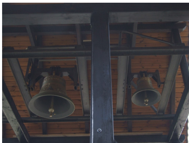
Dzwonnica przy sanktuarium