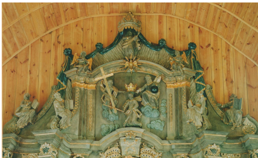
nr 2 Grupa koronacji Najświętszej Maryi Panny, Ewangelistów.

Ołtarz zdobiony jest ornamentem rocailleowym, akantowym, kampanulowym i motywem kratki, pokryty wtórną polichromią w odcieniu kości słoniowej, ze złoceniami w partiach detalu.