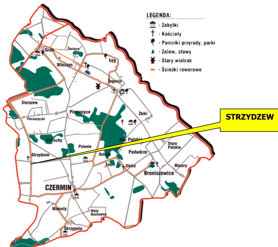
Rys. 1 – Lokalizacja miejscowości Strzydzew na terenie gminy Czermin

Jego położenie charakteryzuje się bezpośrednim połączeniem z drogą wojewódzką nr 443 relacji Jarocin – Gizalki – Rychwał – Tuliszków. Droga wiodąca przez wieś łączy się z drogą powiatową nr 13102 relacji Pleszew – Grab. Powierzchnia gminy Czermin wynosi 9 775,80 ha z czego powierzchnia Strzydzewa stanowi 459,82 ha